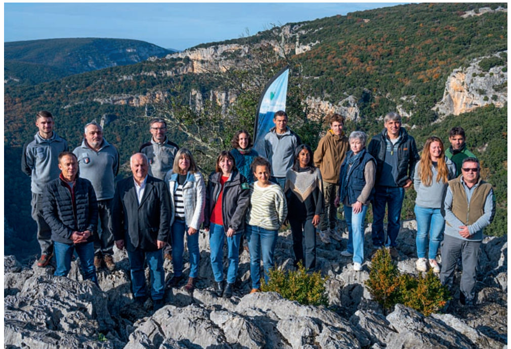
L'équipe du Syndicat de Gestion des Gorges de l'Ardèche