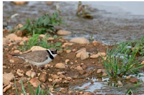
Petit gravelot - Charadrius dubius .

que de nombreuses autres espèces d'intérêt communautaire, s'y reproduisent et s'y alimentent. Ainsi, c'est par des mesures de gestion adaptées et de concertations locales, que le SGGA s'engage à préserver la richesse avifaunistique de ce site. Cela passe notamment par le partage et la transmission de ces connaissances nouvelles aux acteurs publics et privés du territoire (les habitants, les élus, l'Établissement Public Territorial de Bassin Ardèche, etc.).