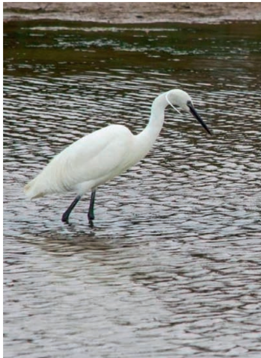
Aigrette garzette - Egretta garzetta .