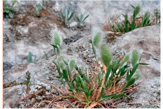
Le Polypogon - Polypogon maritimus .

Les résultats montrent que ces milieux sont particulièrement vulnérables aux changements climatiques. Les espèces présentes aujourd'hui sont adaptées à la chaleur et à la sécheresse, et il est difficile de présager quelles autres espèces et cortèges d'espèces seraient capables de leur succéder dans le