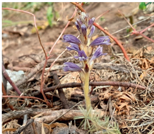
La Phélipanche des vires - Phelipanche cingularum .

La Phelipanche des vires, ainsi nommée pour son habitat de prédilection, n'est connue que de quelques rares zones rocheuses calcaires escarpées. Elle a été découverte à l'occasion de prospection botanique commune