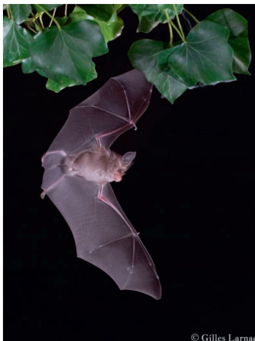
Rhinolophe Euryale - Rhinolophus Euryale .

Depuis 2000, un suivi des populations de chauves-souris est réalisé chaque année par le SGGA et la LPO. La conservation des chauves-souris est un enjeu majeur dans les